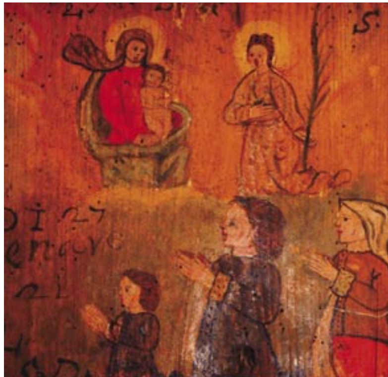
Tierra Bomba Piccola donna